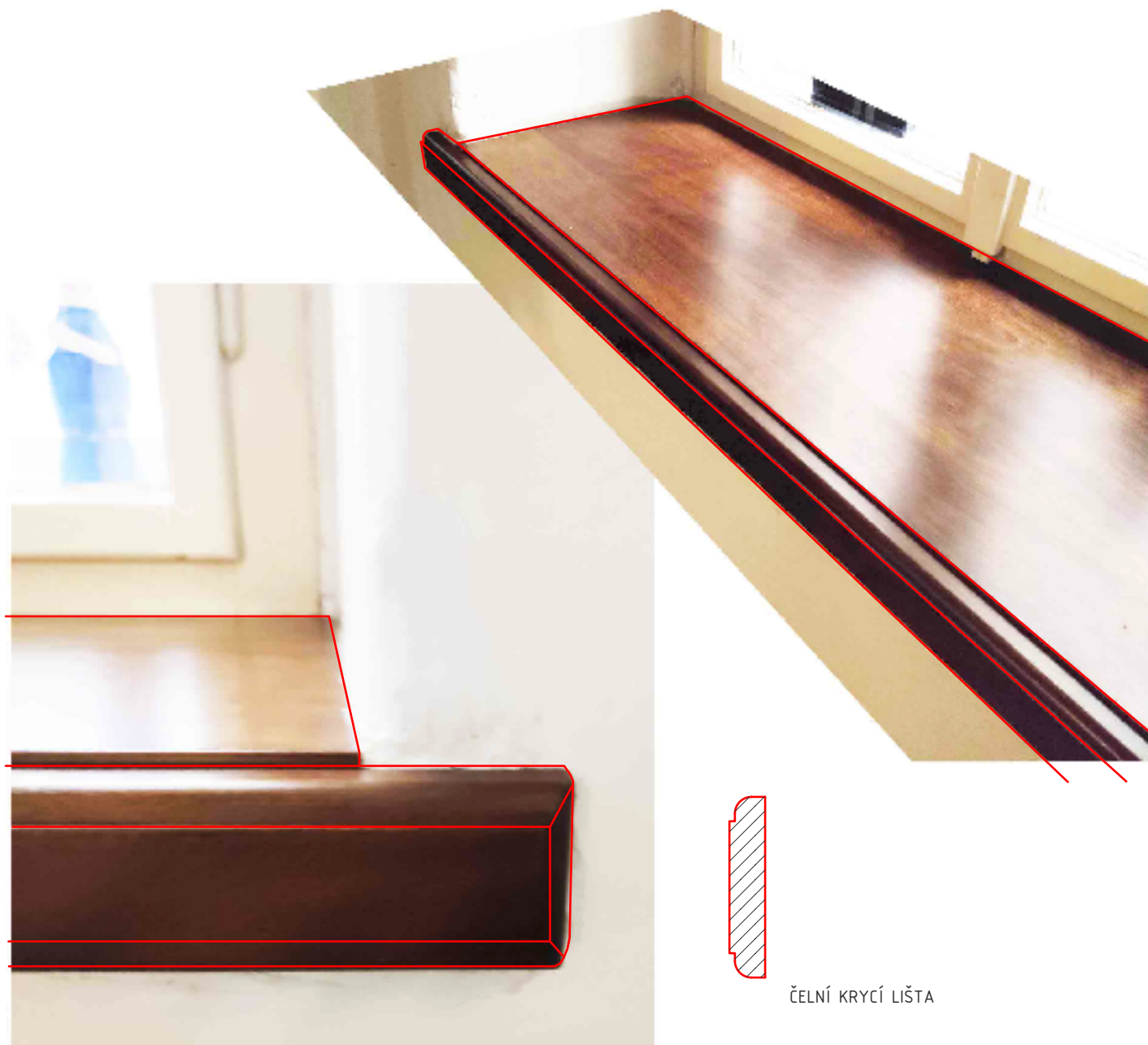
ČELNÍ KRYCÍ LIŠTA

SCHEMATICKE ŘEŠENÍ (VZOROVÉ) DŘEVĚNÉHO PARAPETU Z MASIVU